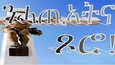
ፖስ ኢሳቅ በራሽ

እዚ ኣብቲ ናይ መበል 25 ዓመታዊ ብስራት ደብረት ወንጌላውያን ጉባኤ፡ ብፓስተር ኢሳቅ በራሽ ካብ ዚተዋህበ ትምህርቲ ሓዘል መልእኽታት ሓደ፡ “ንሱ ንሐጠአትና ዶሮ”፡ ዚብል እዩ ነይሩ።